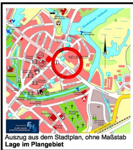
Auszug aus dem Stadtplan, ohne Maßstab Lage im Plangebiet

Vorhabenbezogener Bebauungsplan Einkaufs- und Dienstleistungszentrum „Sankt – Annen – Galerie“ Brandenburg an der Havel