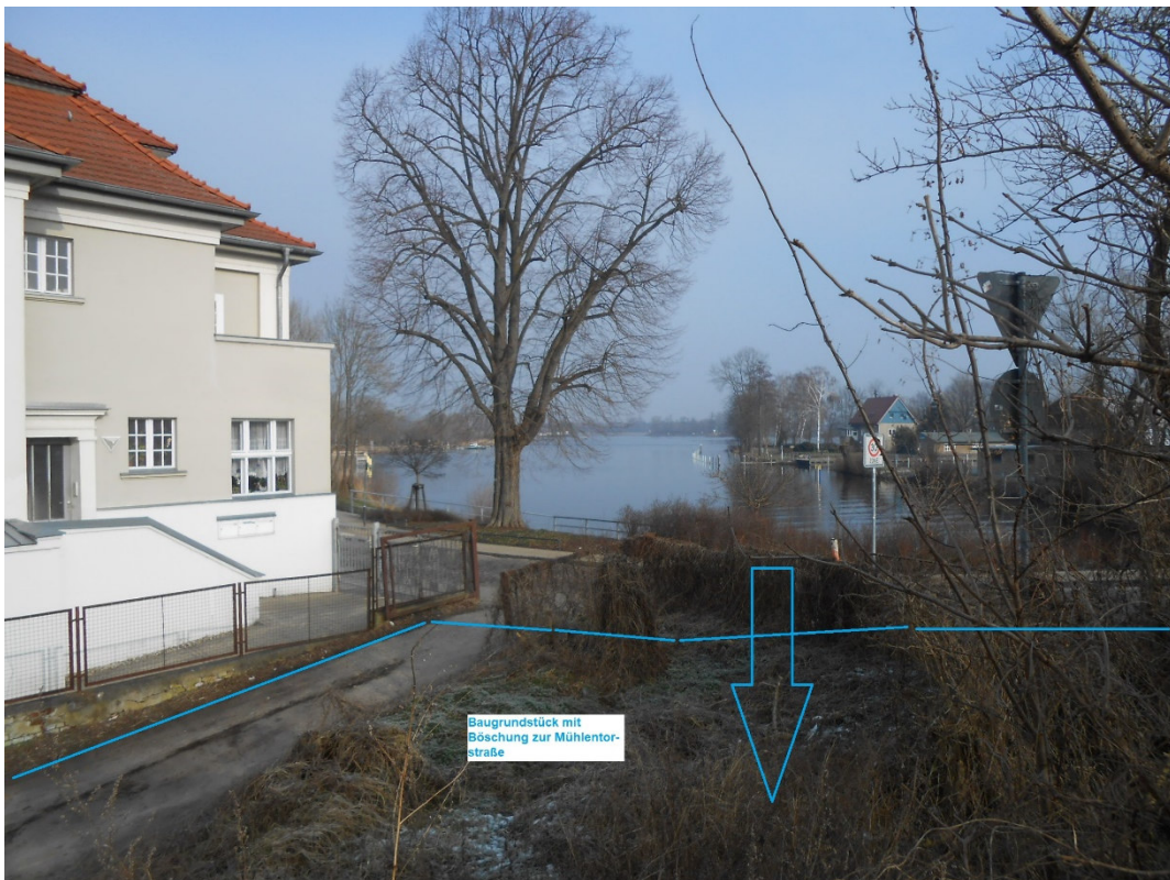
Blick Richtung Beetzsee