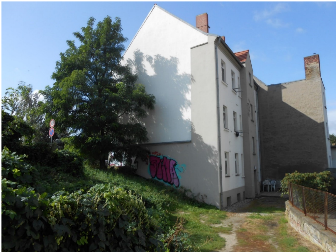
Grundstück mit Einfahrt von der Straße Beetzseeufer aus gesehen. Die Robinie wurde inzwischen gefällt. Im Hintergrund das Nachbargrundstück mit dem Haus Mühlentorstraße 21