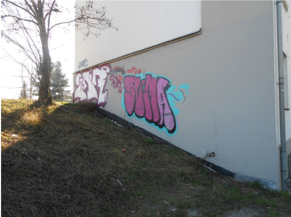
Böschungslage der Baufläche. Blick auf den Nachbargiebel Mühlentorstraße 21. Die Robinie wurde inzwischen gefällt .