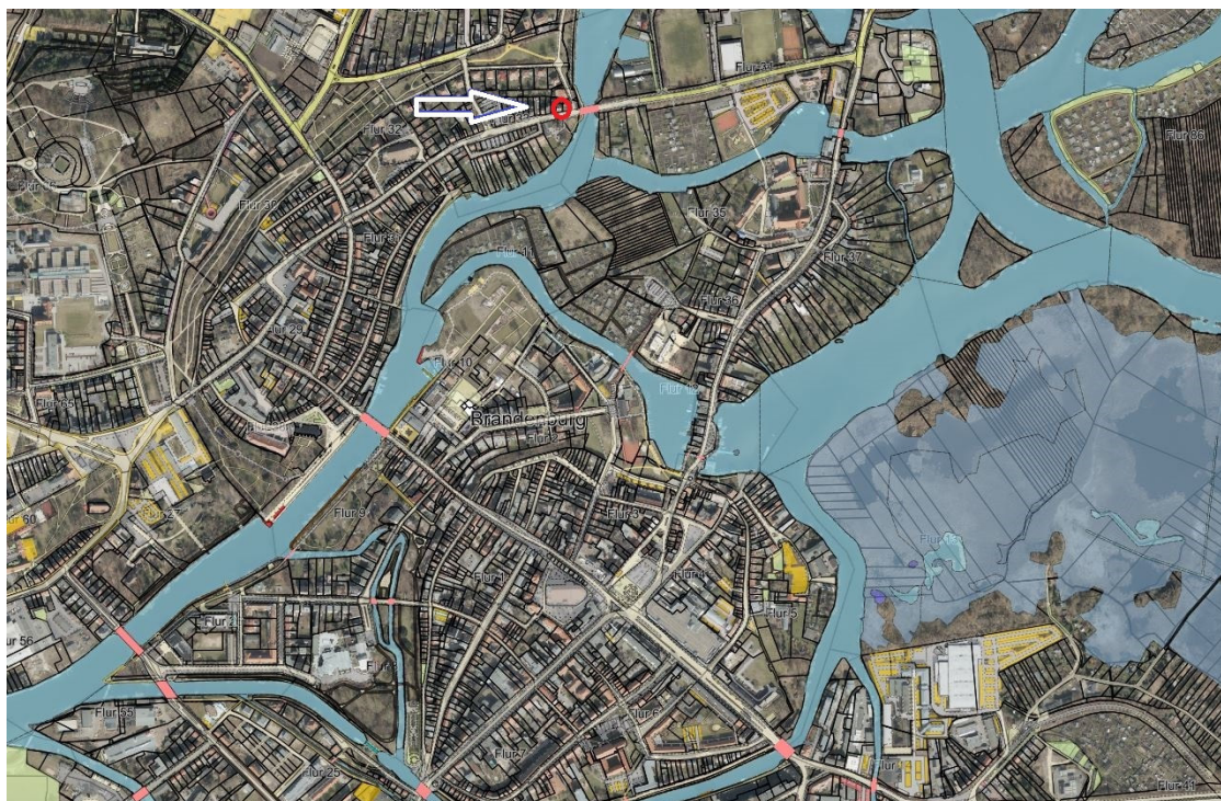
Lage des Grundstücks in der Stadt Brandenburg an der Havel, Auszug aus Geodaten GDI. BRB