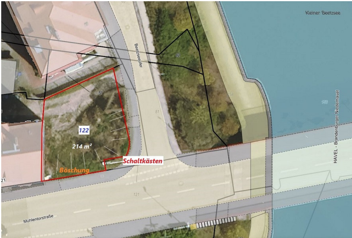
Flurstück 122 der Flur 33. Auszug aus Geodatenbeständen GDI. Brandenburg