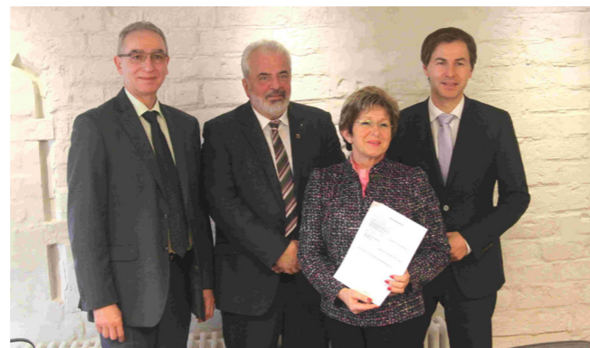
Vertragsunterzeichnung am 14.12.2012

Die Stadt Brandenburg an der Havel wird dadurch ihrer Funktion als „wirtschaftsstruktureller Anker der Region“ gerecht. Nicht zuletzt aus diesem Grund ist das Projekt, welches aus Mitteln des Bundes und des Landes Brandenburg gefördert wird, von der Landesregierung als prioritäre Maßnahme eingestuft.