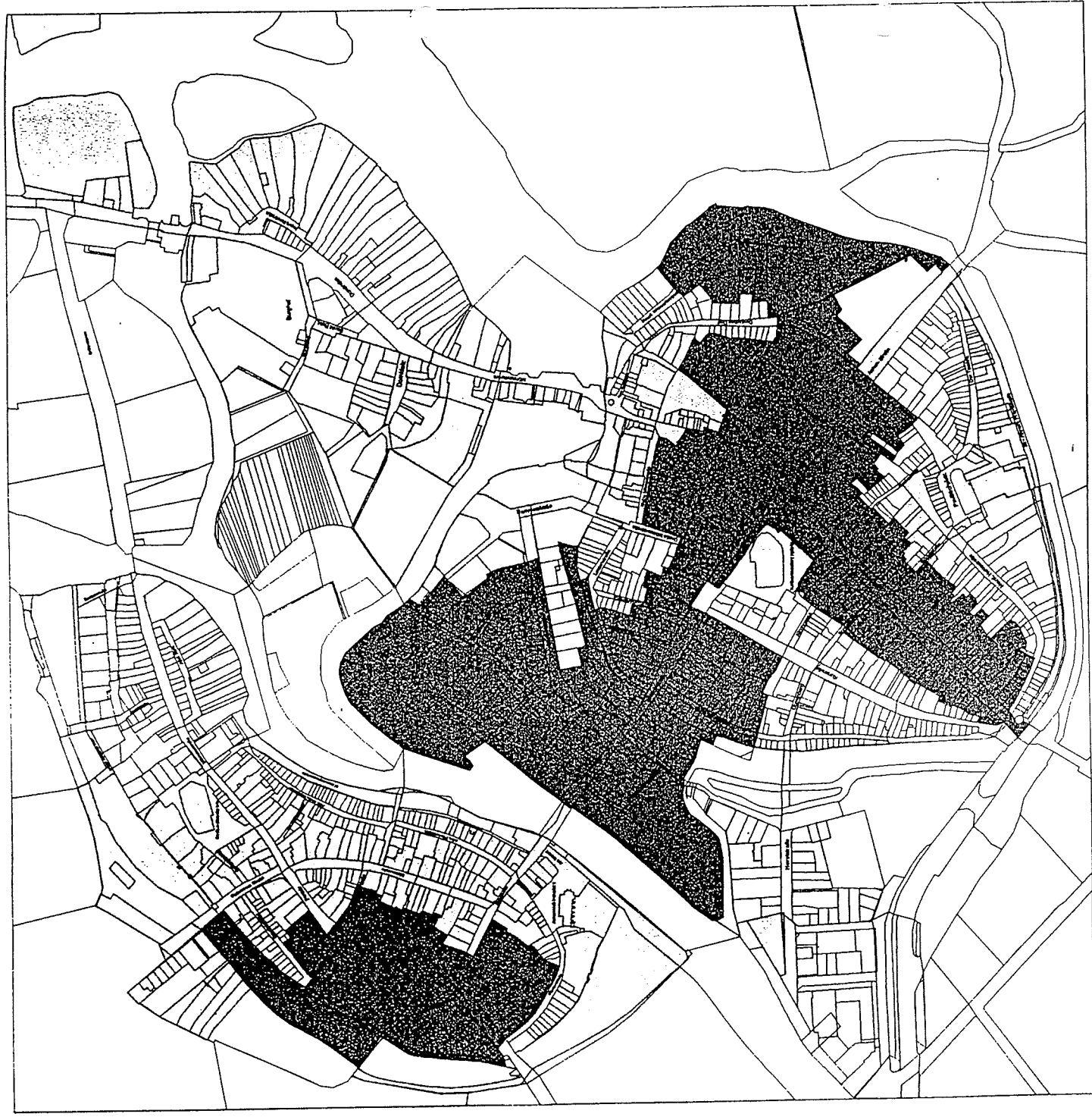
Übersichtsplan Brandenburg an der Havel Sanierungsgebiet "Innenstadt I und II"