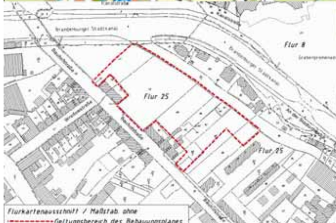
Flurkartenausschnitt / Maßstab ohne - - - - - Geltungsbereich des Bebauungsplanes

Vorhabenbezogener Bebauungsplan/ Vorhaben- und Erschließungsplan "Havelkiez" Brandenburg an der Havel Übersichtskarte mit Abgrenzung des Plangebiets M: ohne