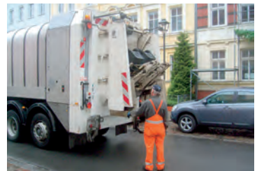
Abholung von Restmüllbehältern.

Dabei müssen die Behälter bis 6.00 Uhr am Entsorgungstag an die nächste befahrbare Straße gestellt werden.