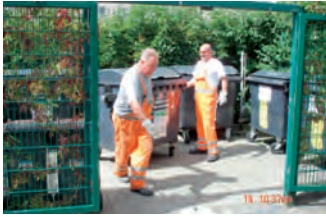
Abholung von Restmüllbehältern.