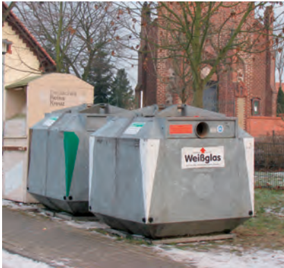
DSD- Container für Glas

Achtung: Behälterglas, das weder weiß- noch braunfarbig ist, gehört in den Container für Grünglas.