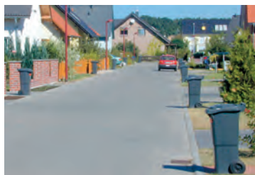
Zur Abholung bereitgestellt.

Auf dem am Abfallbehälter fest installierten Chip ist unveränderlich eine Nummer gespeichert, über die nach dem Auslesen in der Software die eindeutige Zuordnung zum Grundstückseigentümer sowie zu Abfallart, Behältergröße und Leerungsrhythmus erfolgt.