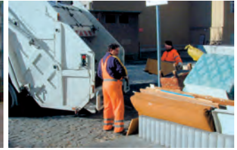
Abholung von Sperrmüll.