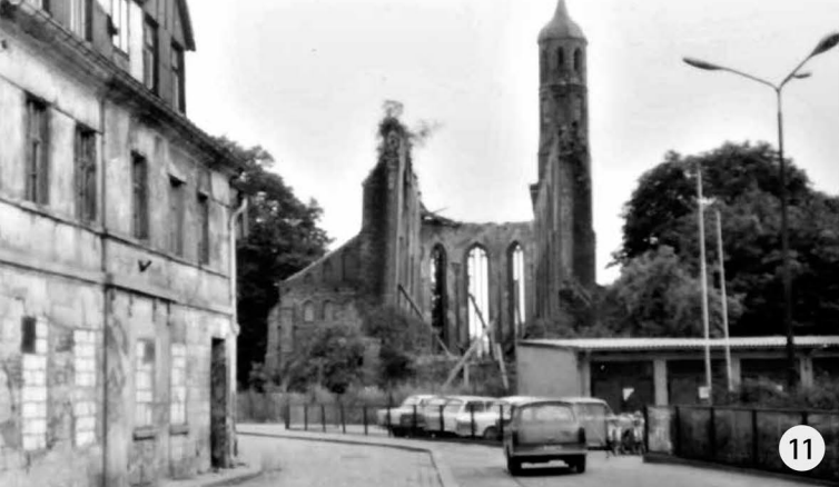
Titel: Johanniskloster nach Alberti E. 18 Jh., Aquarell 19. Jh. (Museum im Frey Haus) Abb. 1 Nordportal mit Maßwerkrosette, Zeichnung 1912 (aus: Die Kunstdenkmäler der Provinz Brandenburg, Band II, Teil 3) Abb. 2 Alte Sakristei, Rankenmalerei A. 15. Jh., Vorzustand 2014 (Sandra Bothe) Abb. 3 Hauptschiff, Blick nach Nordosten, Foto um 1895 (BLDAM) Abb. 4 Neue Sakristei, „Ölbergzene“ E. 15. Jh., Zustand während der Freilegung 2015 (Sandra Bothe) Abb. 5 Hauptschiff, Blick nach Südwesten, Foto um 1895 (BLDAM) Abb. 6 Hauptschiff, Blick nach Nordosten, Foto um 1905 (BLDAM) Abb. 7 Ansicht des Westgiebels, Foto 1932 (Stadt Brandenburg/Havel) Abb. 8 Grundriss 1912 (Darstellung Bauphasen, Stand 2015) (aus: Die Kunstdenkmäler der Provinz Brandenburg, Band II, Teil 3) Abb. 9 Hauptschiff, Blick nach Westen, Foto nach 1945 (BLDAM) Abb. 10 Ansicht des Westgiebels, Foto nach 1945 (Domstiftsarchiv) Abb. 11 Ansicht des Westgiebels, Foto um 1986 (Stadt Brandenburg/Havel)