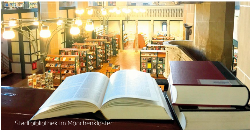
Stadtbibliothek im Mönchenkloster