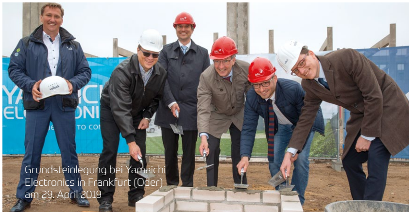
Grundsteinlegung bei Yamaichi Electronics in Frankfurt (Oder) am 29. April 2019