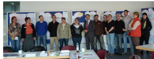
Besuch vom Minister Günter Baaske

Am 23.04.2013 besuchte Minister Günter Baaske (MASF) das Projekt und informierte sich bei den Teilnehmenden der Vorgründungswerkstatt über ihre Arbeit.