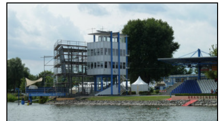
Bereits deutlich erkennbar ist der Neubauteil des markanten Zielrichterturmes.

Technik und die Ausstattung der zukünftig für die Kampfrichter und Organisatoren zusätzlich zur Verfügung stehenden Räume.