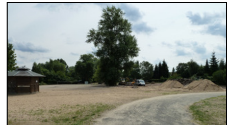
Die Umgestaltung des Erholungsortes neben dem Ruderer-Platz hat begonnen. Die Brandenburger müssen vorübergehend auf eine der vielen anderen Badestellen ausweichen.

die Voraussetzungen geschaffen, um diesen Bereich zukünftig während großer nationaler und internationaler Sportveranstaltungen bei Bedarf als Erweiterung für den Ruderer-Platz nutzen zu können. Wenn alles planmäßig läuft, kann bereits im Oktober die Neubepflanzung erfolgen, so dass der vorübergehend gesperrte Strand in der nächsten Badesaison wieder für die Öffentlichkeit zur Verfügung steht.