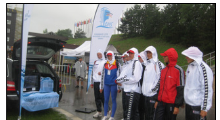
Trotz Wind und Regen: Infos zu Brandenburgs WM-Bewerbung waren auch in Račice bei vielen Sportlern und Funktionären begehrt.

zerhand der Mercedes-Kofferraum zum Infostand umfunktioniert.