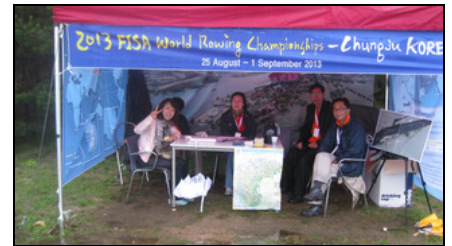
Freundlicher Gruß vom koreanischen Team.

dem zurückgezogen, damit Amsterdam zum Zuge kommt. Dass die Brandenburger gute „Verlierer“ sind, zeigten Sie kürzlich in Račice, wo es am Rande der Junioren-WM freundschaftliche Kontakte und einen Erfahrungsaustausch mit der Delegation aus dem koreanischen Chungju gab, gegen die man 2009 „verloren“ hatte.