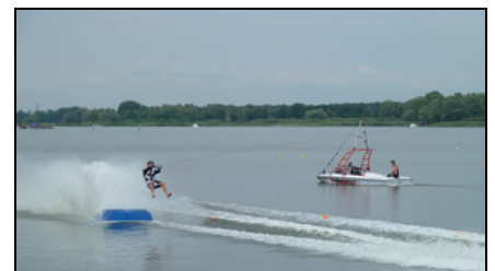
Mit fast 80 km/h geht es auf blanken Sohlen übers Wasser und die Sprungschanze. Der neue Weltrekord steht bei 29,90 m.

ten und Tricks. Dass der Beetzsee auch für diese spektakuläre Sportart ideale Voraussetzungen bietet, belegen mehrere hier erzielte Weltrekorde im Springen. Die Vertreter des Internationalen Barfuß-Wasserski-Verbandes waren überwältigt von den hervorragenden Wettkampfbedingungen und der großen Sportbegeisterung und Gastfreundschaft der Havelstädter.