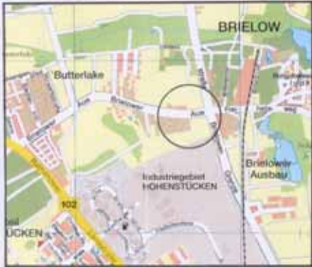
Lage im Stadtgebiet Auszug aus dem Stadtplan

Geltungsbereich der Innenbereichs- und Abrundungssatzung nach § 34 Abs. 4 Nr.1 und 3 BauGB Bereich "Brielow Aue" Brandenburg an der Havel - - - Planbereich