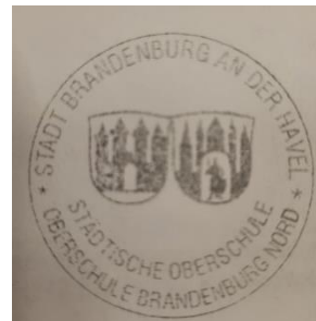
Abbild des Dienstsiegels

Der unbefugte Gebrauch von Dienstsiegeln wird strafrechtlich verfolgt. Sollte das Dienstsiegel gefunden werden, wird gebeten, dieses bei der Stadt Brandenburg an der Havel, Haupt- und Personalamt, Klosterstraße14, abzugeben.