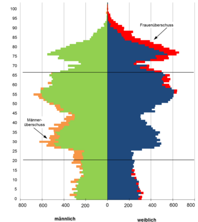
Lebensbaum Stadt Brandenburg an der Havel 2017