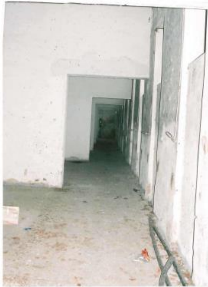
Innenteilansicht der Gebäude Nr. 304 und 305 mit Blick auf den Flurbereich