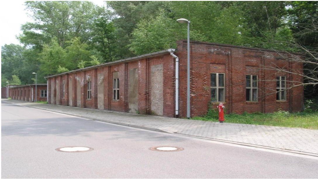
Gebäude 307, 308 und 306 im Oktober 2017