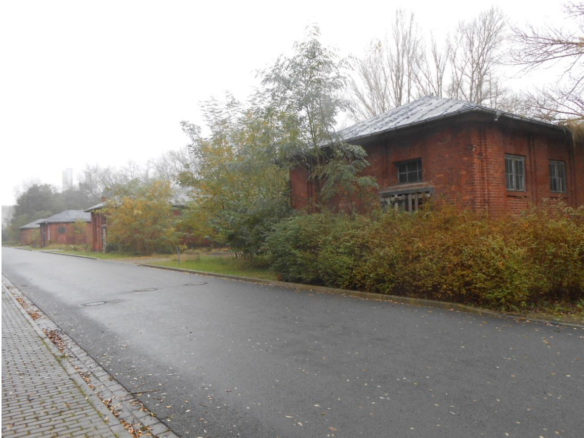
Gebäude 304 (Foto unten) und 305 (Foto oben) im Oktober 2017