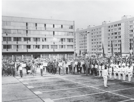
Eröffnungszeremonie der Frauen-Ruder-EM auf dem Neustädtischen Markt am 09. August 1972.

Die Eröffnungszeremonie der Brandenburger Frauen-Ruder-EM fand am Abend des 09. August 1972 auf dem Neustädtischen Markt im Herzen der Havelstadt statt. Zuvor hatten der Fanfarenzug der SG Dynamo Potsdam, ein Fahnenblock mit DDR-Fahnen und DSRV-Fahnen, die internationalen Schiedsrichter und alle 21 teilnehmenden Mannschaften mit jeweils einem