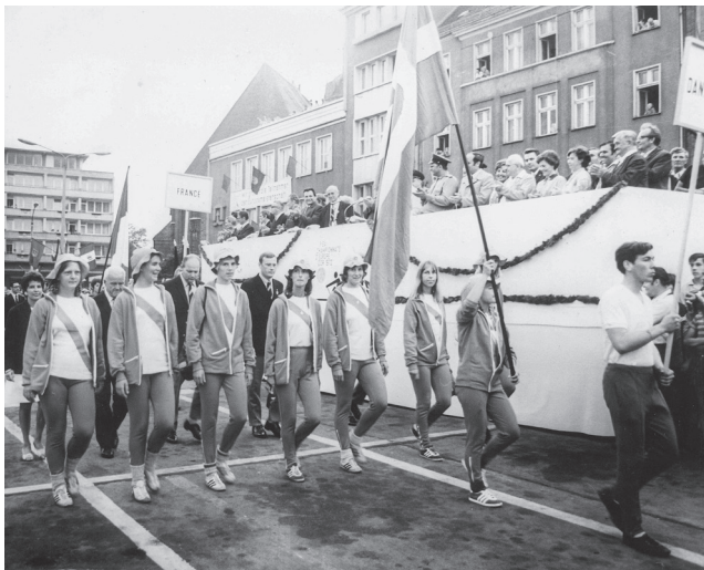
Vorbeimarsch der teilnehmenden Nationen an der Ehrentribüne, 9. August 1972.

Markt in Bewegung, zog an der Ehrentribüne vorbei und nahm - umringt von zahlreichen Brandenburgerinnen und Brandenburgern - an vorher markierten Punkten Aufstellung. Nach der Ansprache des Oberbürgermeisters erklang die Fanfare der FISA, dann ergriff deren Vizepräsident F. Aa Hansen das Wort und erklärte die EM offiziell für eröffnet. Nach der DDR-Nationalhymne ging die Zeremonie mit dem Abmarsch der Sportlerblöcke zu Ende. Nicht nur für die Sportlerinnen, die sich über die Vor- und Hoffnungsläufe sowie die Semifinals in die Finals kämpfen mussten, waren die EM-Tage anstrengend. Auch die FISA-Spitze und die Delegationsleitungen hatten alle Hände voll zu tun.