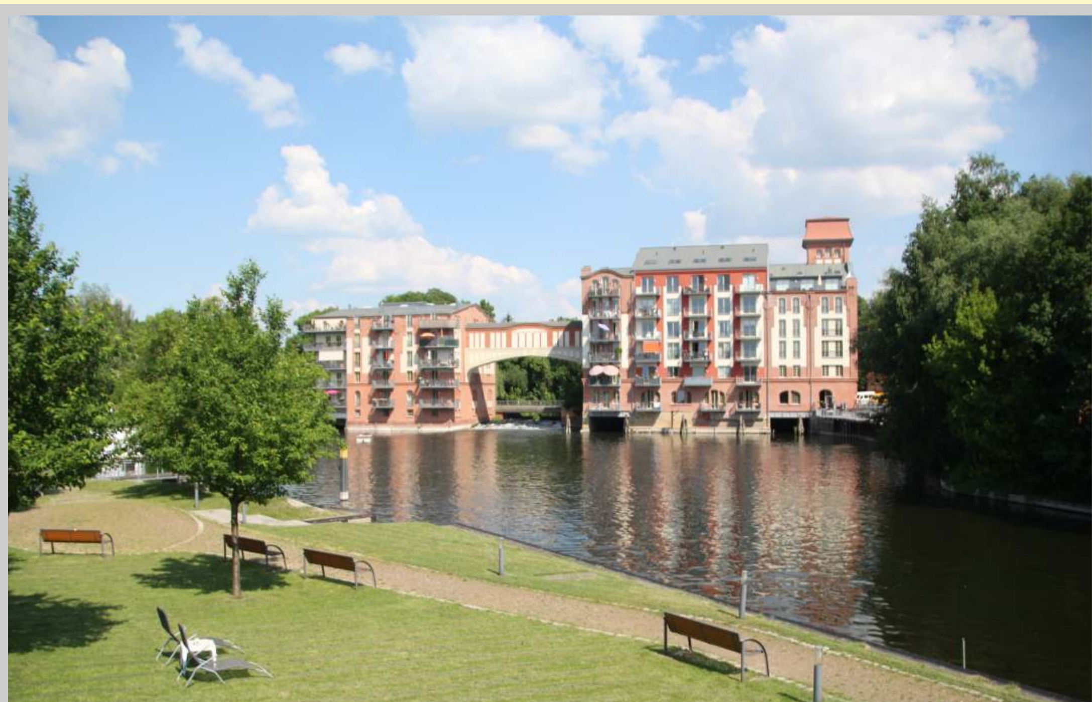
Loftwohnungen in der „Alten Mühle“