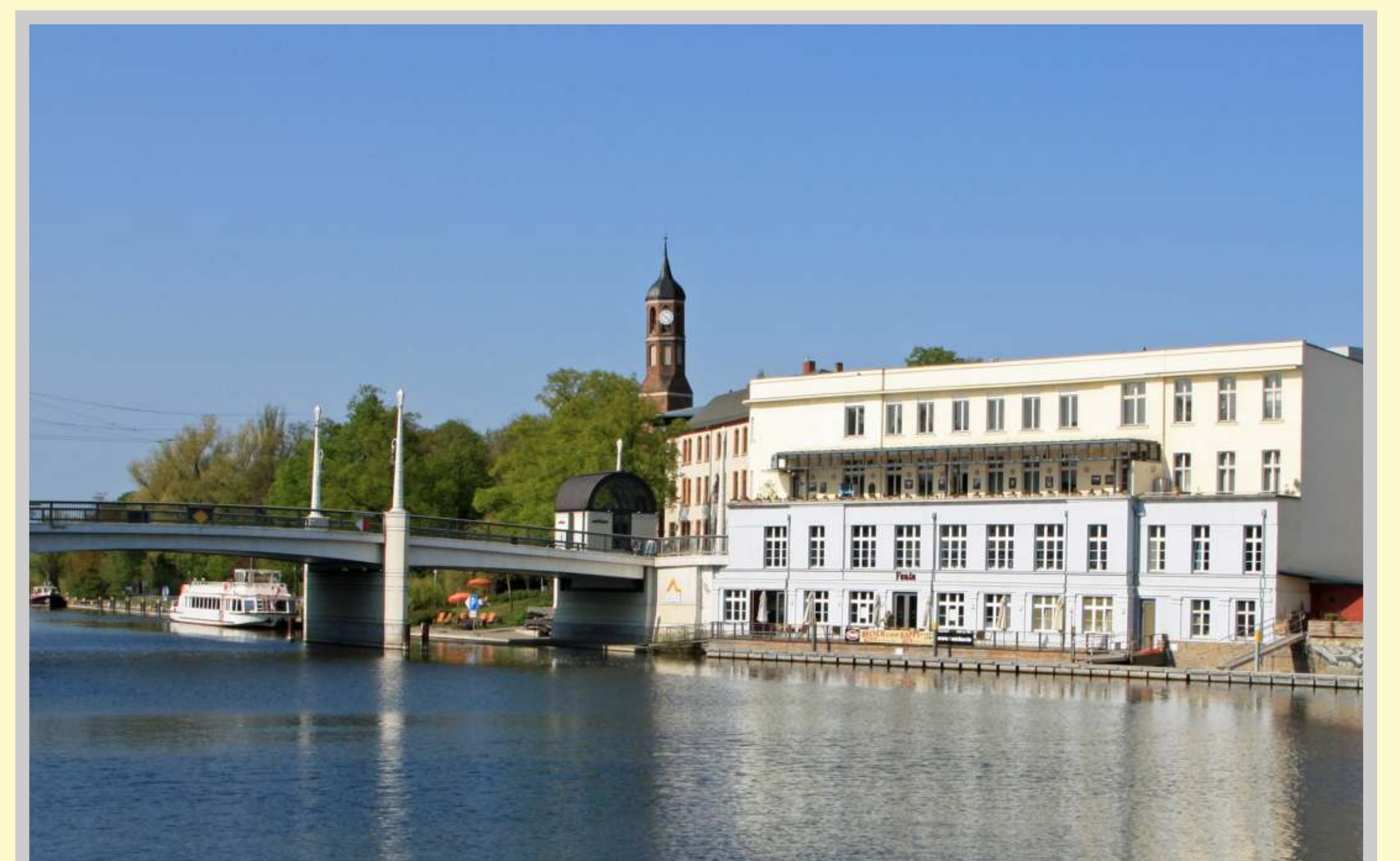
Jahrtausendbrücke und Fontaneclub