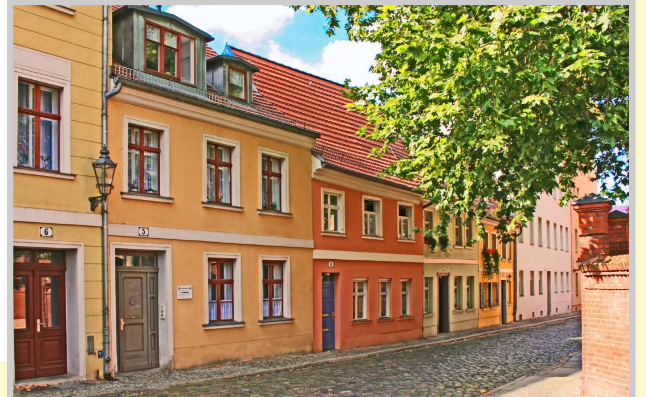
Kirchgasse zum Dom St. Peter und Paul