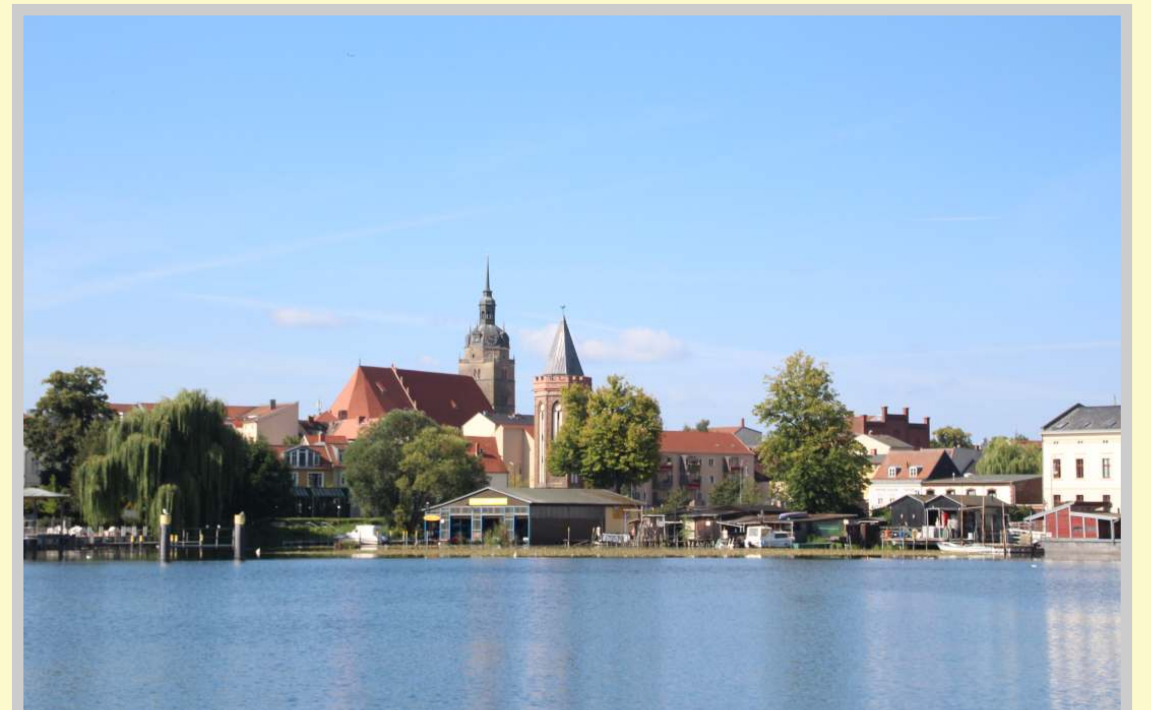
Blick auf den Mühltorturm und die Kirche St. Katharinen