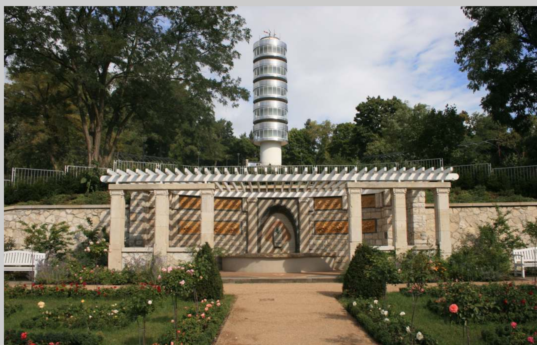
Marienberg mit Friedenswarte und Blick auf die Muschelgrotte