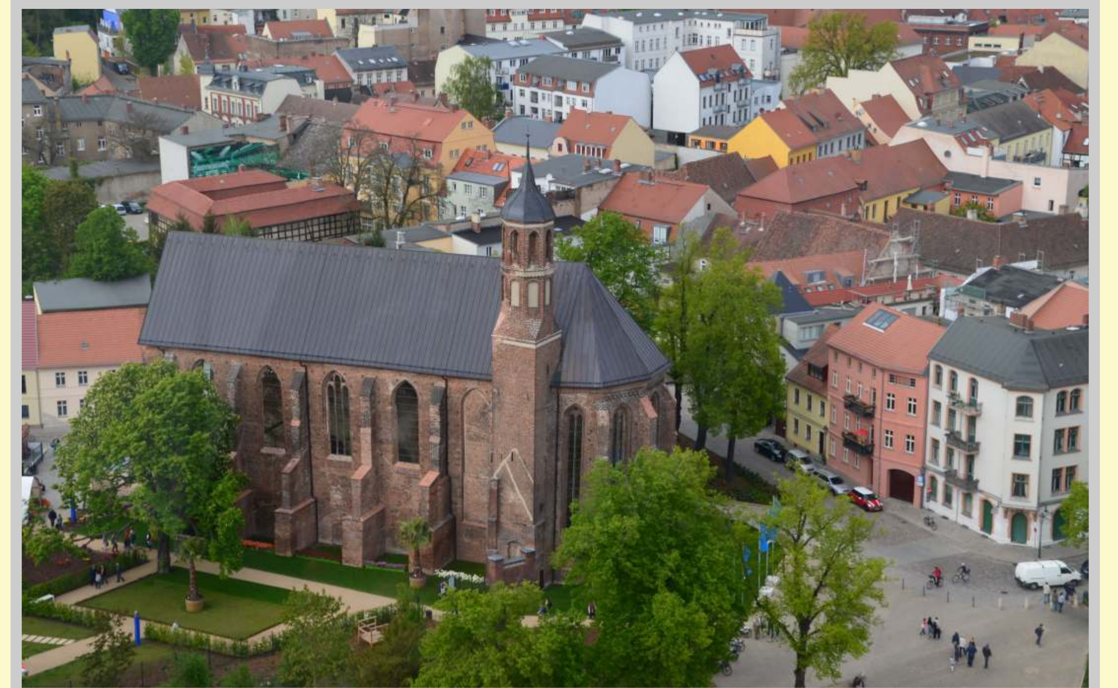
St. Johanniskirche am Salzhof