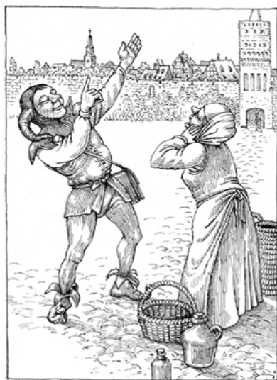
Wie Till Eulenspiegel einmal Wettermacher sein sollte